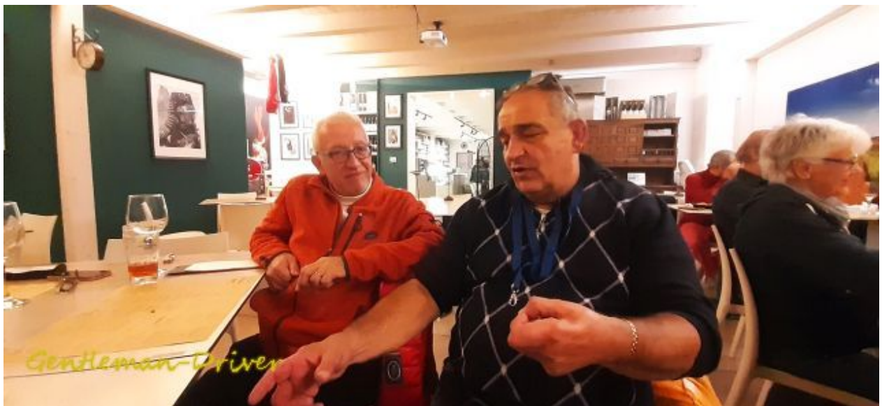
Hier mein Freund: