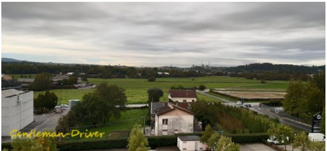
Da unten, Lariofiera Porta B: