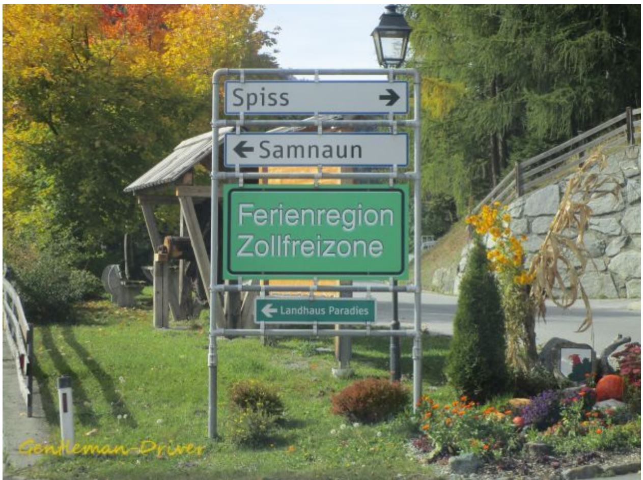
Die Begrüssung, oben am Berg: